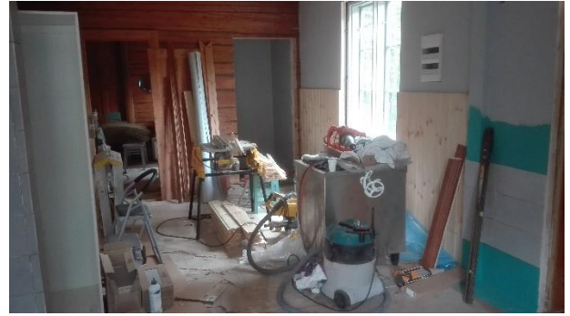
Keittiöstä näkymä valmistuvaan kokoustilaan ja wc:hen