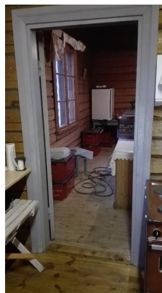
Näkymä keittiöstä ravintolasaliin